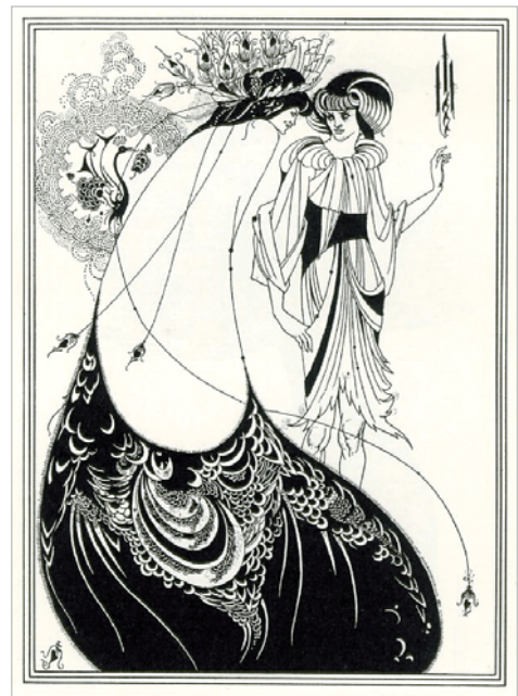
Fig. 2 Ilustración de Aubrey Beardsley para la Salomé de Oscar Wilde

Esta Salomé bíblica cuyo nombre conocemos gracias al historiador hebreo Flavio Josefo, ha sido recreada en diferentes geografías y épocas por pintores, escritores, cineastas y actrices; su historia ha brindado oportunidad de mostrar tanto la pasión masculina y las turgencias del cuerpo femenino como escenas de lujo oriental que generalmente corresponden al imaginario occidental sobre esas latitudes antaño lejanas. Muchos se han abocado a la tarea de representar a Salomé: entre los pintores, el Ticiano, Moreau; entre los escritores, Oscar Wilde; entre los músicos, Richard Strauss; entre las actrices de Hollywood, Rita Hayworth 8 . Me interesa recordar el drama del escritor inglés Oscar Wilde (1854-1900) 9 porque transforma la tradicional historia bíblica: en éste Juan el Bautista rechaza los avances de una tentadora Salomé; ante tal desprecio la vengativa joven pide su cabeza. La ópera de un acto de Richard Strauss (1864-1949)